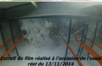
Extrait du film réalisé à l'occasion de l'essai réel du 13/11/2014