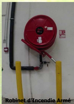
Robinet d'Incendie Armé

GRUEL – FAYER Labastide est autorisé à stocker jusqu'à 7350 tonnes de produits de protection des plantes. Aucune fabrication, aucun mélange de produits chimiques n'a lieu sur le site. Les produits sont tous conditionnés en bidons, cartons ou palettes.