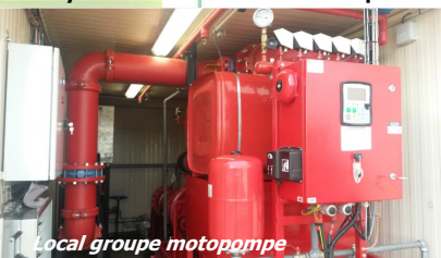
Local groupe motopompe