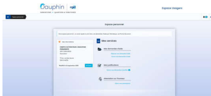
Figure 1 : nouvel espace personnel de l'espace Usagers

Lors du dépôt du CRF, le porteur devra signer l'attestation sur l'honneur, la scanner et la rattacher.