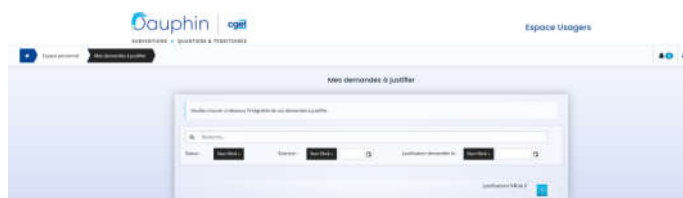
Figure 2 : interface des demandes à justifier

Le porteur pourra filtrer les subventions à justifier sur le libellé de la demande, son statut ou l'exercice