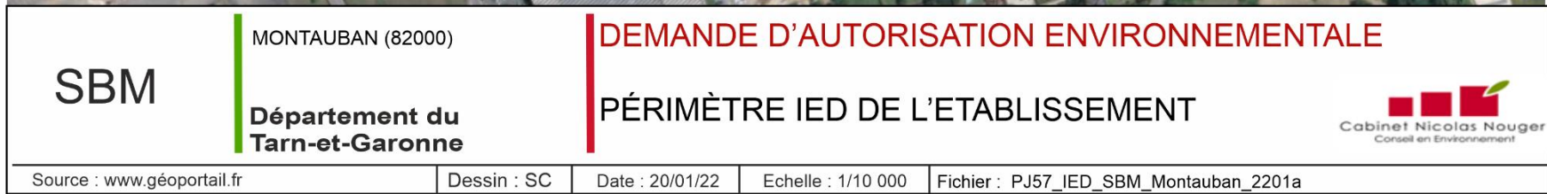
Figure 2 : périmètre IED de S.B.M